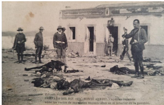
Campaña del Rif, posición de monte Arruit. Capellán rezando ante los restos de españoles encontrados en el interior de la posición.